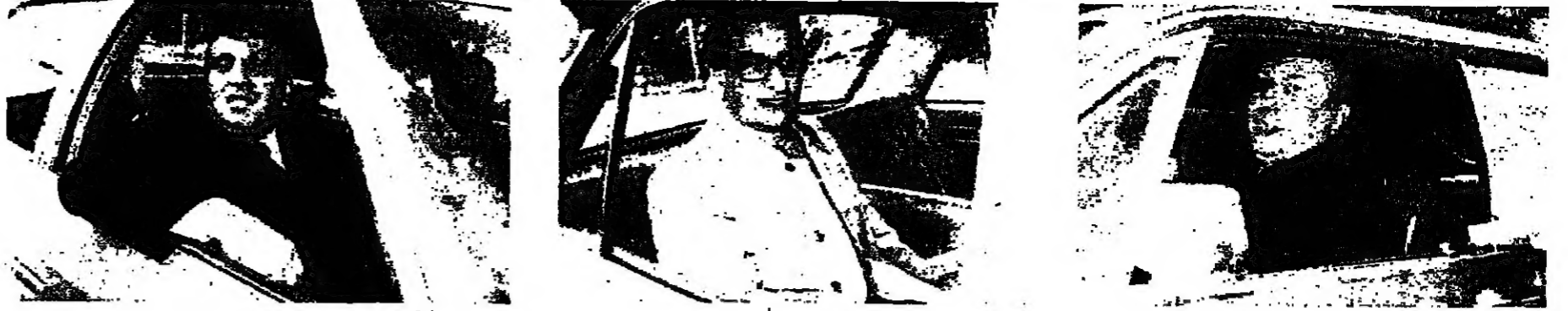
نواب: سركيس الى واشنطن